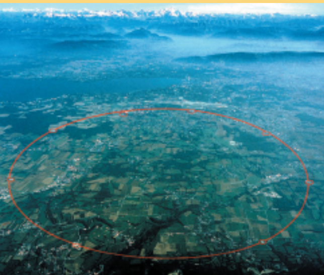
– Vista aérea de las instalaciones del CERN en Ginebra. En rojo la circunferencia de 27 Km. de acelerador LEP

El CERN, además de en los dominios científico, tecnológico y educativo, ha tenido, como deseaban sus fundadores, un importante impacto en la unión de Europa y en las relaciones internacionales. Hoy en día, la Organización mantiene colaboraciones con sesenta países no europeos, algunos muy queridos por nosotros, como es el caso de los países latinoamericanos. ⇨