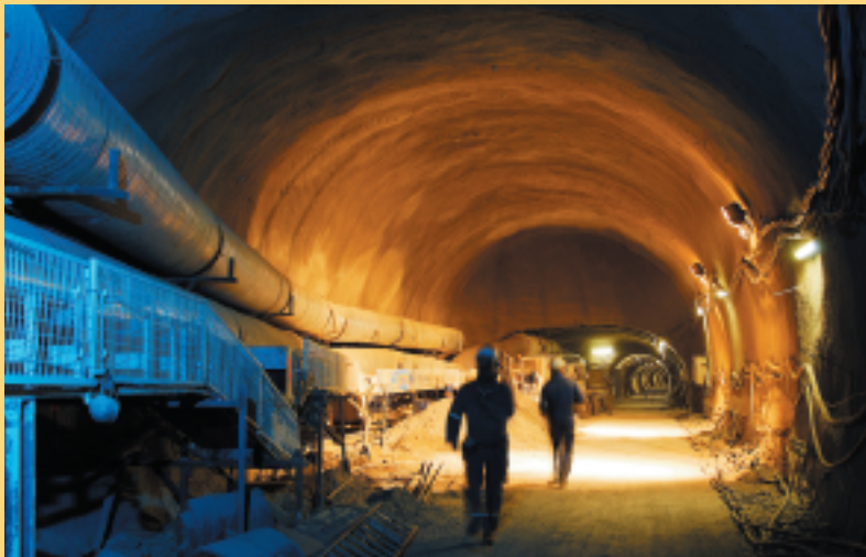
– Trabajos de instalación del acelerador LHC, cuya puesta en marcha se espera para 2007