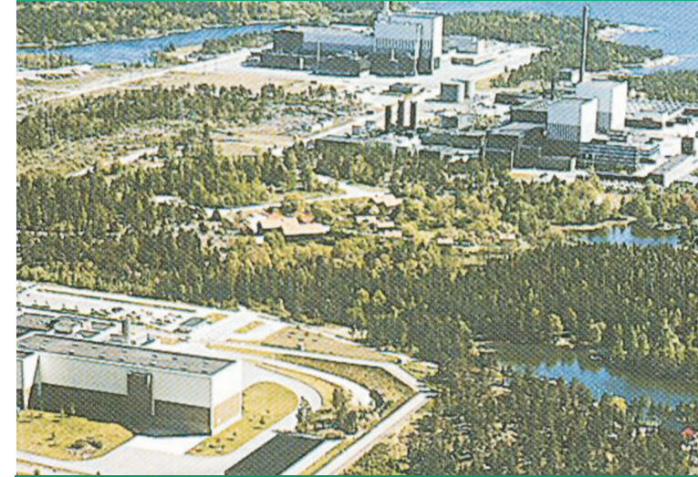
Panorámica de la instalación CLAB, Suecia.