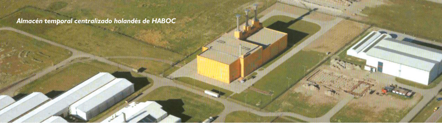
Almacén temporal centralizado holandés de HABOC

La importancia que la energía reviste, como elemento estratégico y clave para el desarrollo y la competitividad de los países, unida a la escasez de recursos energéticos propios, justifica la necesidad de un consenso responsable de todas las fuerzas políticas.